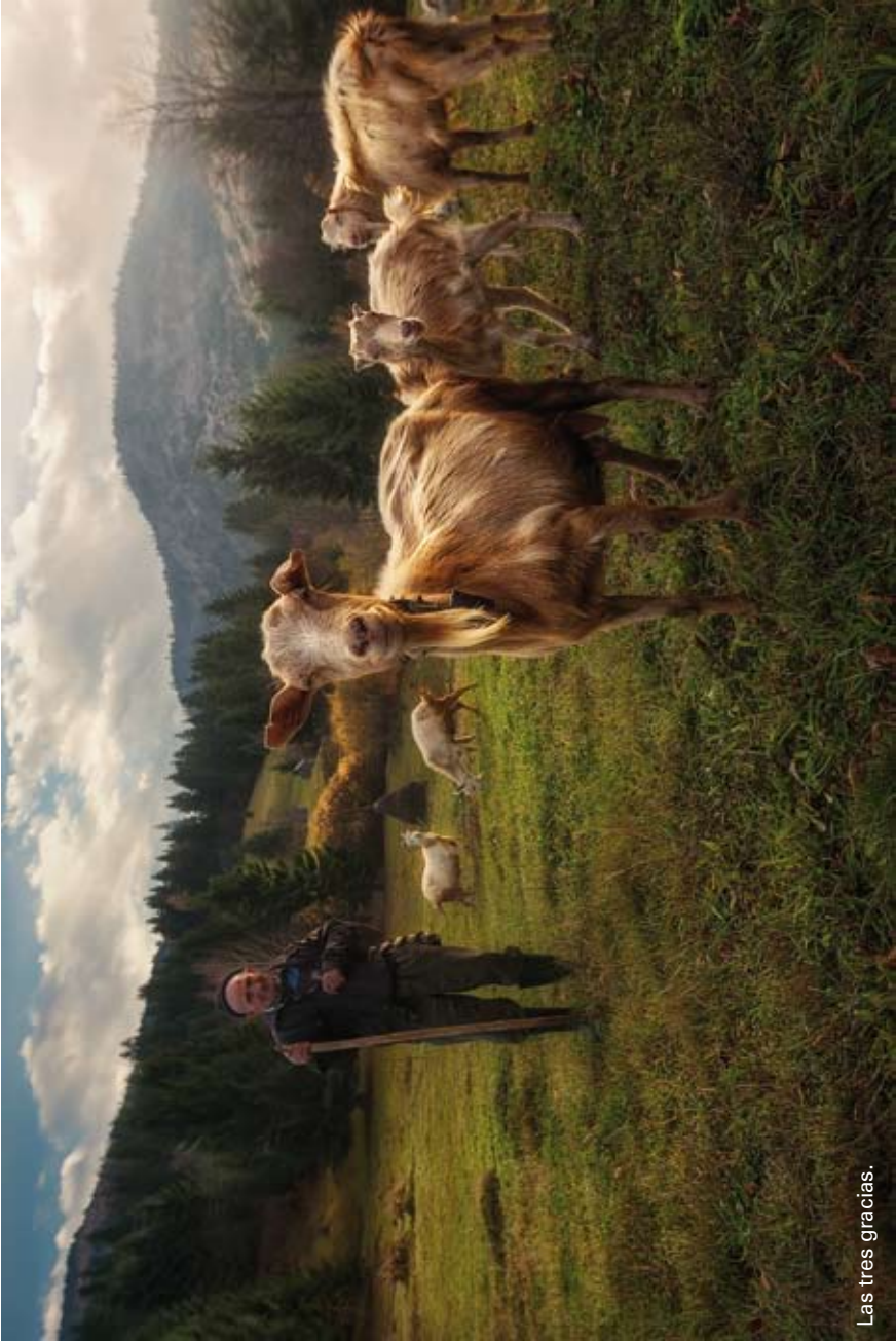
Las tres gracias.