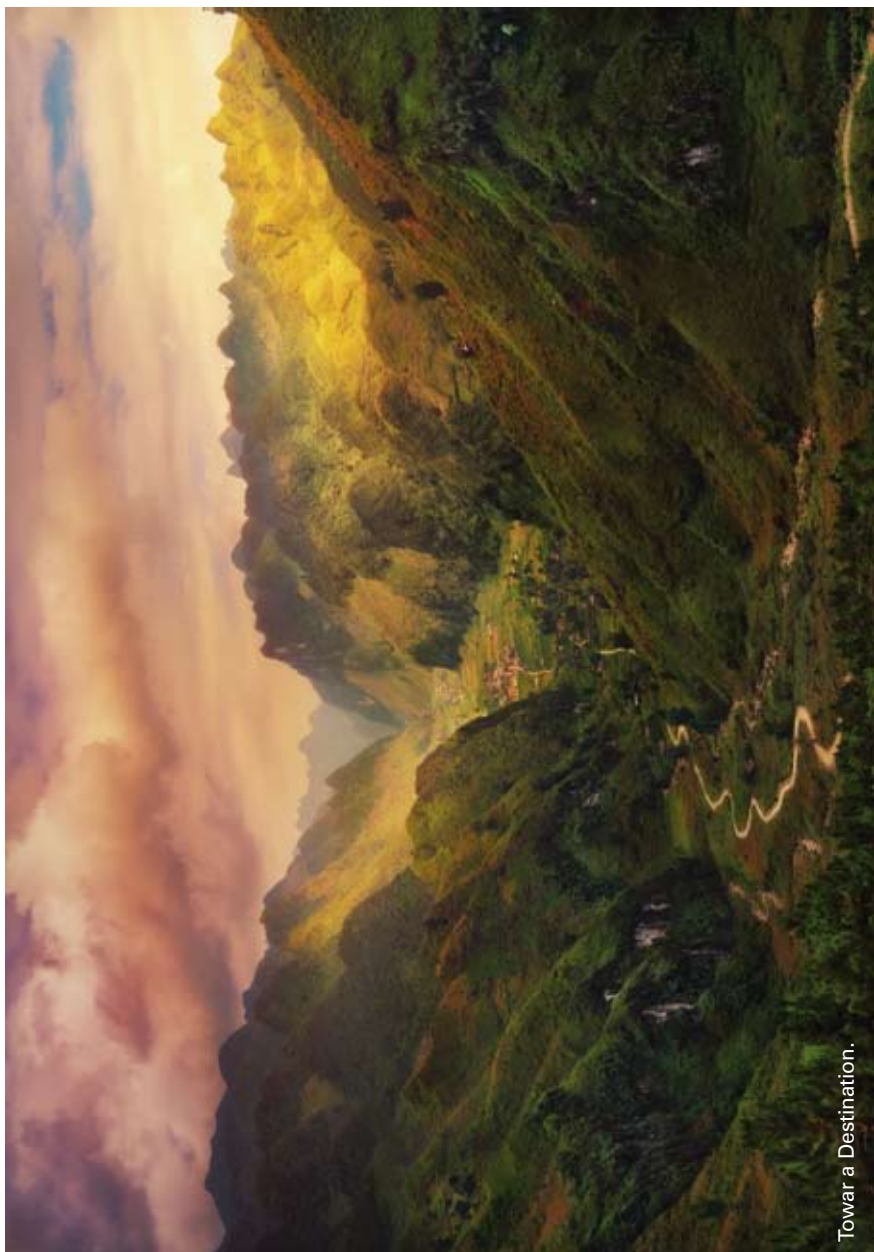
Toward a Destination.