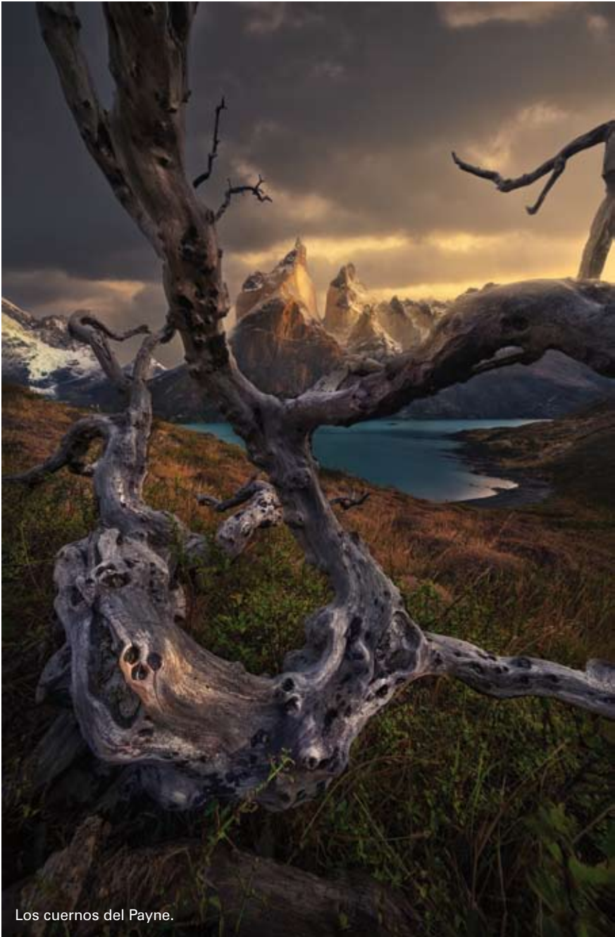
Los cuernos del Payne.