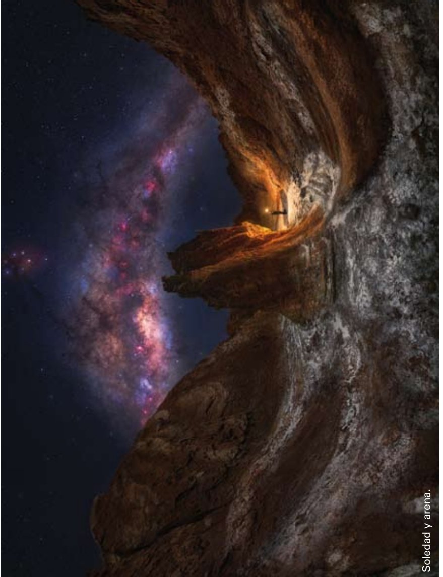
Soledad y arena.