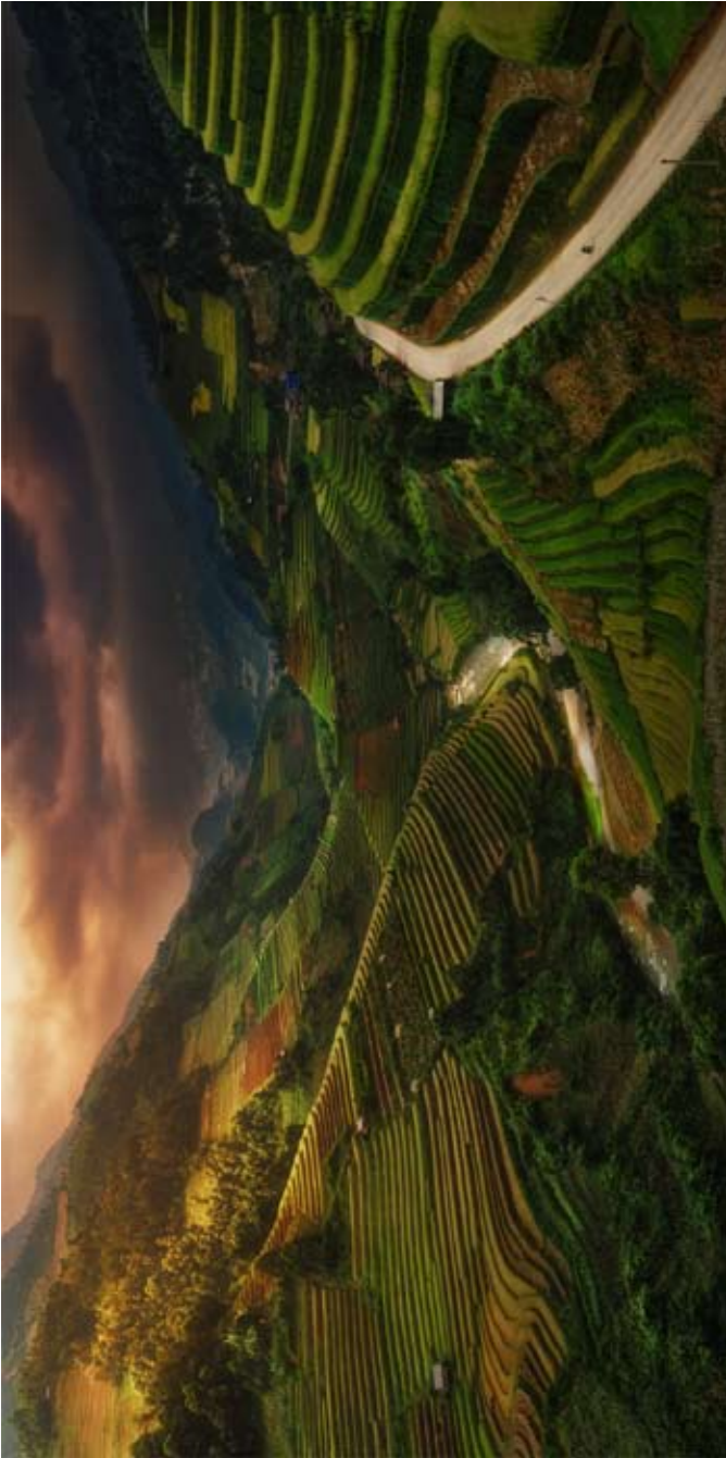
Between Rice Canyon.