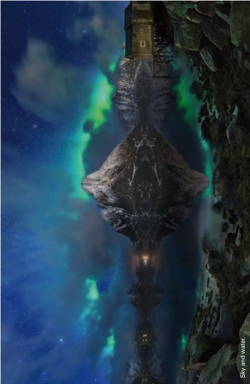
Sky and water.