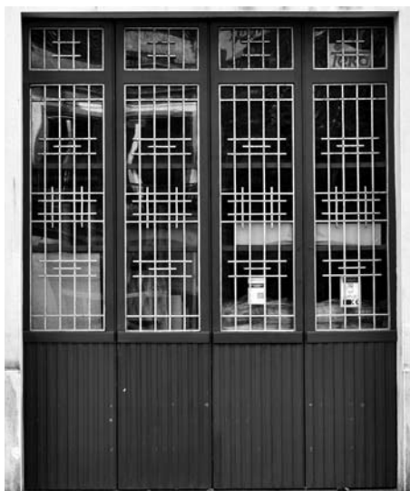
Foto 6. Diante deste mesmo portal, hai setenta anos, posaron profesora e alumnas para a foto número 4