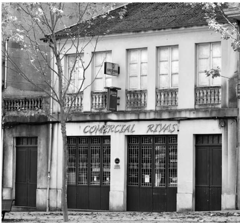
Foto 5. Edificio da Praza da Feira onde impartía docencia Maruja Castro